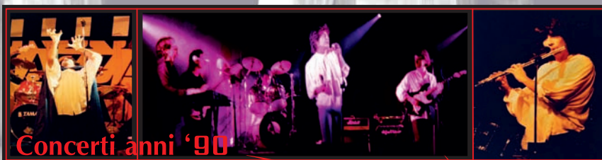
Concerti anni '90